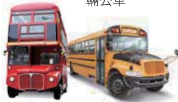
two buses 兩輛公車