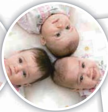
three babies 三個嬰兒