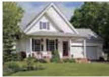
a house 一棟房子