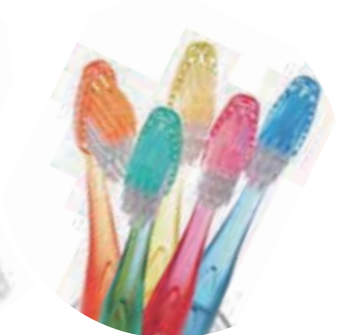
five toothbrushes 五把牙刷