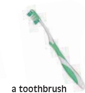
a toothbrush 一把牙刷