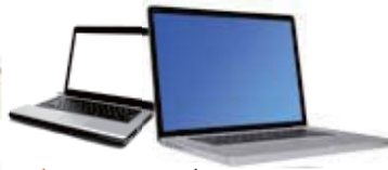
two computers 兩台電腦