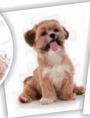
one dog 一隻狗