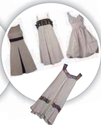
four dresses 四件洋裝