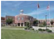
a school 一所學校