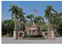
a university 一所大學