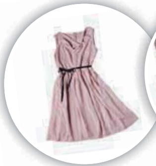
a dress 一件洋裝