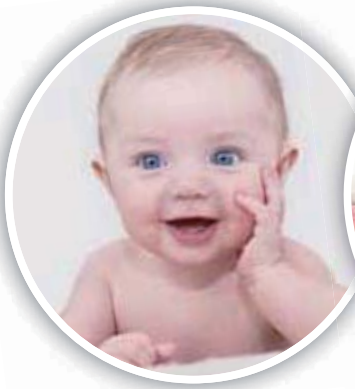
one baby 一個嬰兒