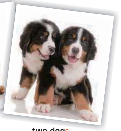
two dogs 兩隻狗