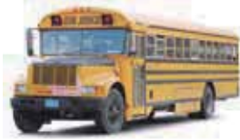
a bus 一輛公車

可數名詞是可以用數量表示的人、事物、地點或動物的名稱。可數名詞具有單數和複數形式，可以用 a、one、two、three 等修飾。