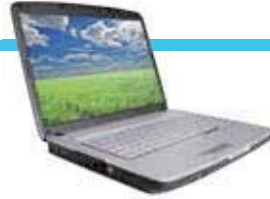
a computer 一台電腦