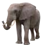
an elephant 一頭大象