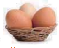
three eggs 三顆蛋