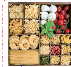
pasta 義大利麵 (通稱)