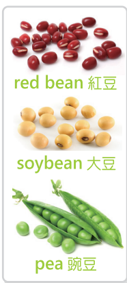
red bean 紅豆