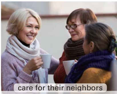
care for their neighbors