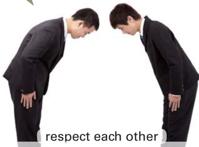
respect each other