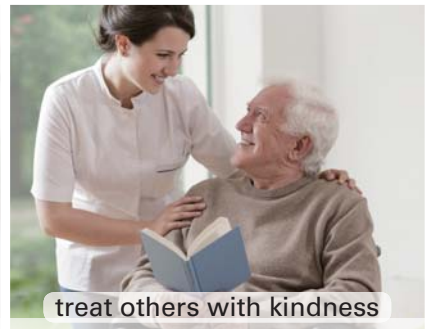
treat others with kindness