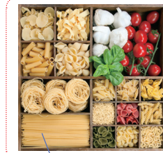
pasta 義大利麵 (通稱)