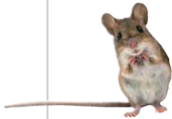
a mouse 老鼠