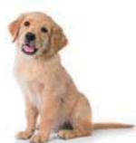
a dog 狗