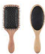
two hairbrush es 兩支梳子