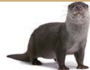
an otter 一隻水獺