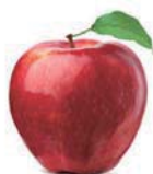
an apple 蘋果