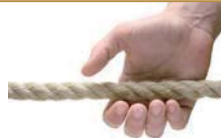
a grab 一把抓