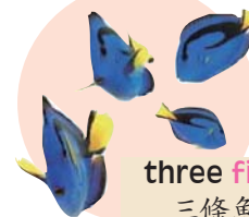
three fish 三條魚