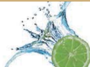
a flop 一聲撲通