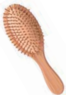
one hairbrush 一支梳子