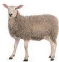
one sheep 一隻羊