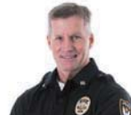
a cop 一名警察