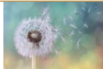
a dandelion 一株蒲公英