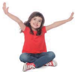
a child 小孩