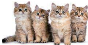
four cat s 四隻貓