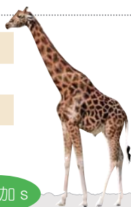
▲ a giraffe