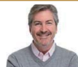
an uncle 一位叔叔