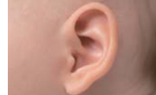
an ear 一隻耳朵