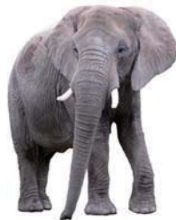
an elephant 一頭大象