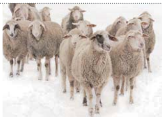
many sheep 許多隻羊

3 魚類的複數形有兩種：fish 和 fishes。指同類魚或泛指魚時，複數形只能用 fish；指多種不同類的魚時，通常也用 fish，但也可以用 fishes。