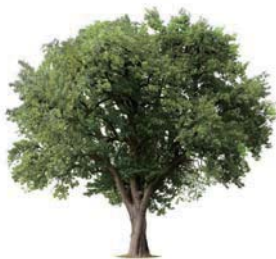
a tree 一棵樹

冠詞是一種用來修飾名詞的詞，分為「定冠詞」 the 和「不定冠詞」 a 、 an ，它們的功能很像形容詞。在非特定的單數可數名詞前面通常要加不定冠詞 a 或 an 。