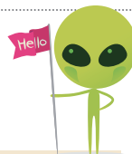
an honest alien 一位誠懇的外星人

有些字的字首拼寫雖然是子音，卻發母音；有些字的字首拼寫雖然是母音，卻發子音。要用 a 或 an ，請以發音為準。