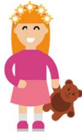
girl 女孩 boy 男孩