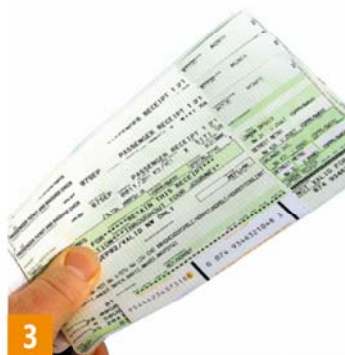
チェックインカウンター 登機櫃檯 チケット 機票